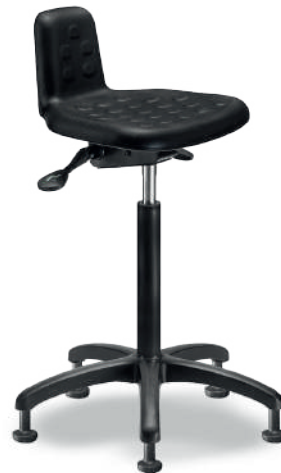
1917 A Sit-Stand antifatiga

Poliuretano tipo piel integral color negro, con giro lateral, ajustable en altura e inclinación.