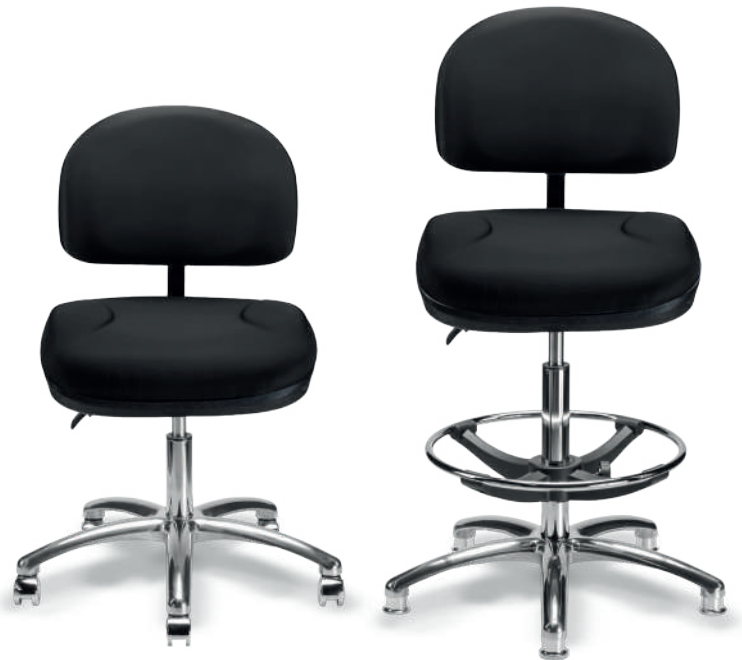
1932 B / 1932 A ESD Respaldo medio