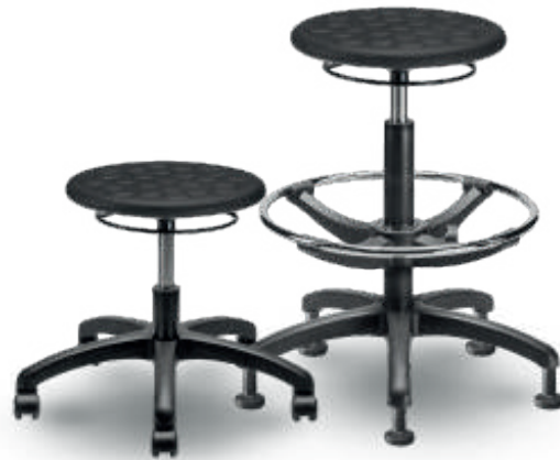
1900 B / 1900 A Banco industrial

Espuma de poliuretano tapizado altura e inclinación. en tela o vinil. Aro descansapiés en modelo alto.